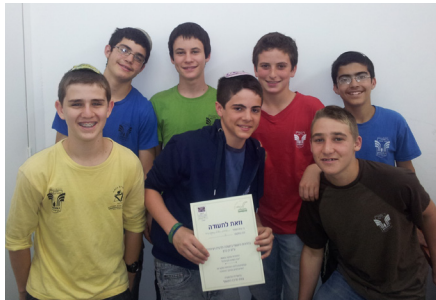
קבוצת התלמידים מחטיבת הביניים אמ"ת נחשון, הזוכה בתחרות האדם הקדמון של "המרכז לחשיבה מדעית ויצירתית".

על הממצאים בנושא האדם הקדמון בארץ ישראל ובעולם. תלמידי ישיבת נחשון התמקדו במיוחד בהשערות השונות בקרב הארכיאולוגים לגבי דמותו ומוצאו של "האדם הקדמון הגלילי", ששרידי התגלו ב-1925 במערת זוטייה שבנחל עמוד. התלמידים, שקראו לקבוצתם "הינשופים",